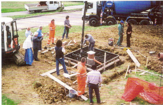
Metà aprile, fondamento Croce luminosa.