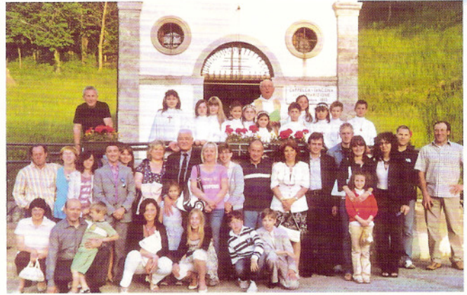
17-5-2009 ragazzi e genitori della 1ª Comunione di Attimis e Racchiuso.