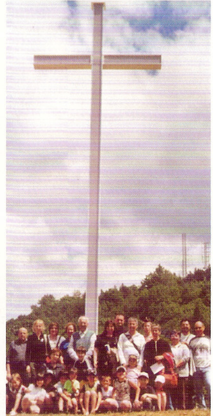
2-6-2009 Pontebba. 11° gruppo sotto la croce.