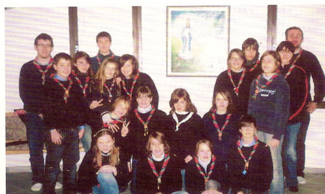
27-28-29 dicembre 2008 scouts reparto Pagnacco.