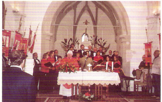
31-5-2009 donatori di sangue di Attimis.