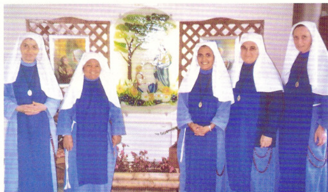
Le cinque suore di Porzùs.