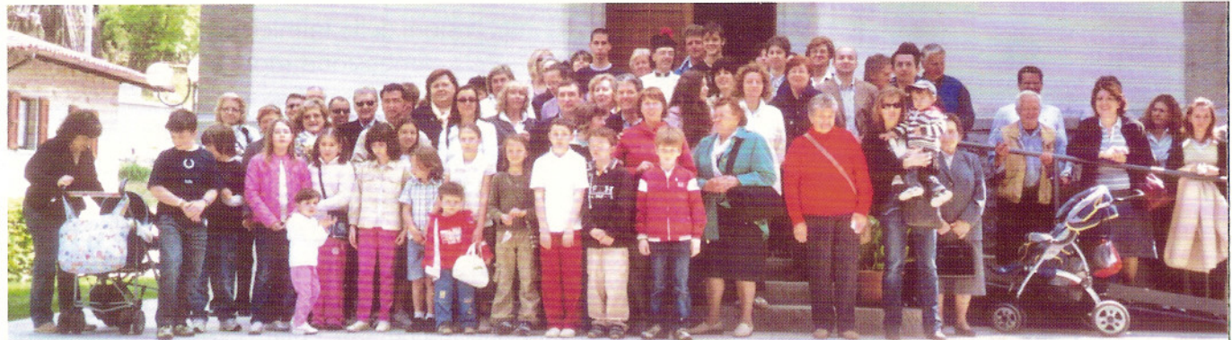
3-5-2009 Rubignacco, Urbignacco.