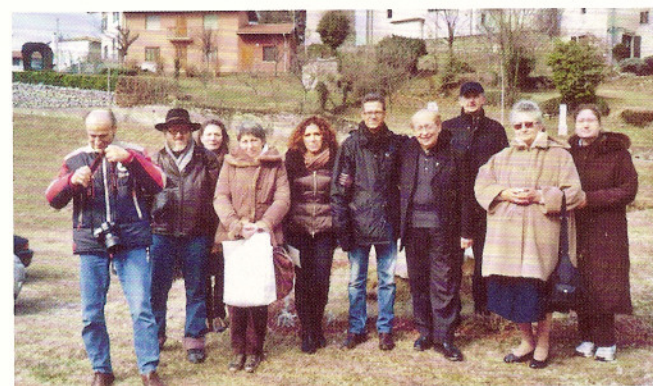
22 febbraio 2009 un gruppo da Udine.