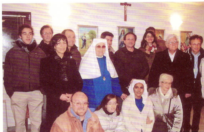
27-12-2008 gruppo di Mantova.