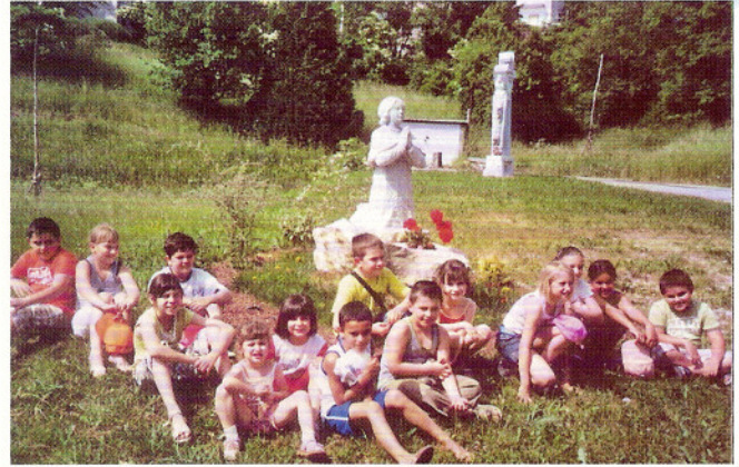
24-5-2009 i ragazzi di Corgnolo.