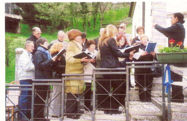
19-4-2009 corale "G. De Luca" di Faedis.