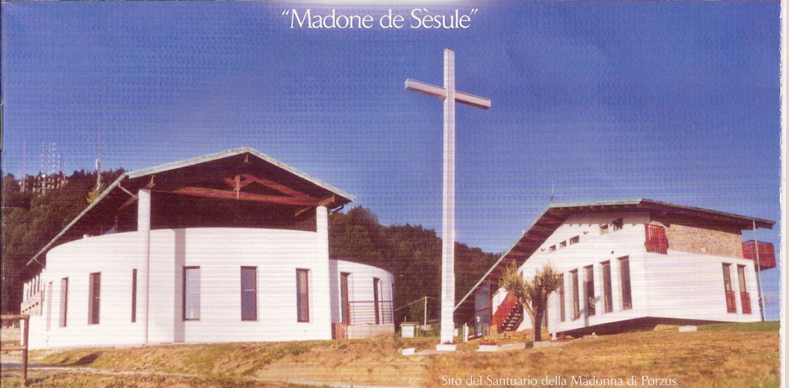
Sito del Santuario della Madonna di Porzûs.