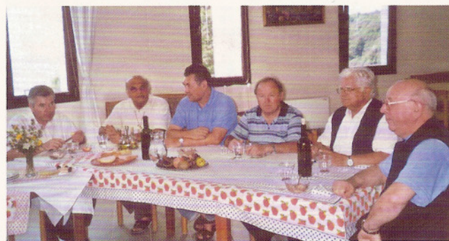
17-8-2009 i sacerdoti della forania di Nimis.