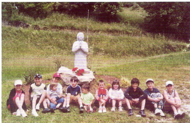
2-6-2009 ragazzi Pontebba.