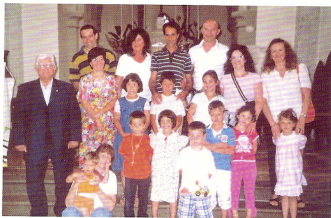
Gruppo misto con tanti bambini.