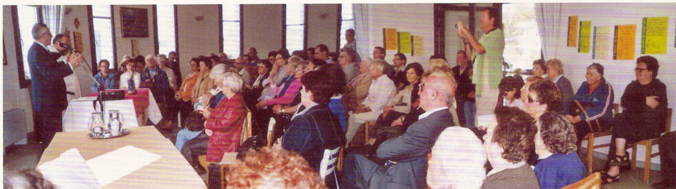
19-9-2009 gruppo del S. Rosario del Triveneto.