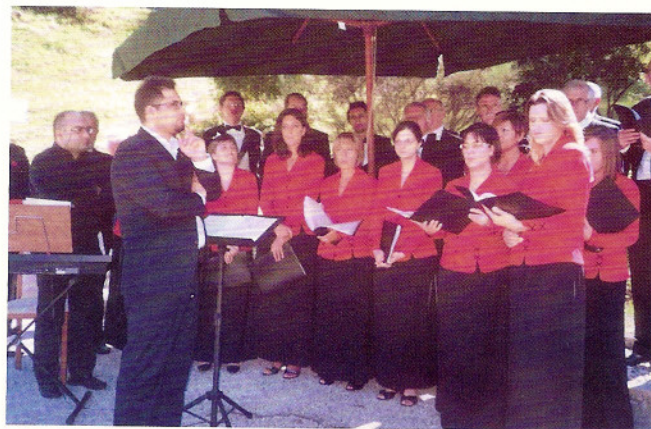
6-9-2009 corale "Faisi Dongje" di Racchiuso.