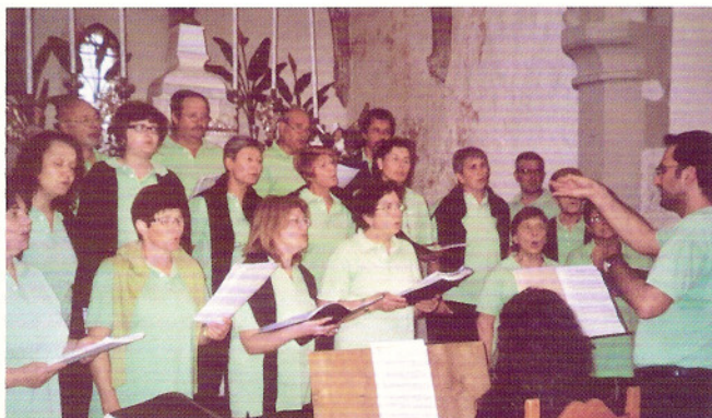
28-6-2009 corale di Cassacco.