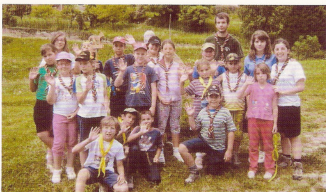
Gruppo del Pordenonese.