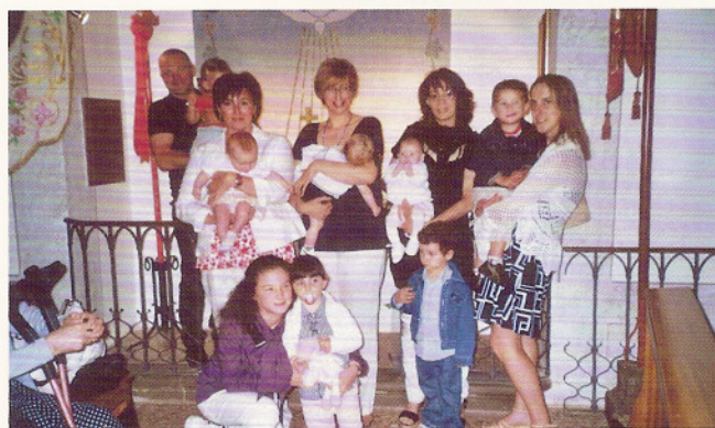
18 luglio 2009 di fronte al Battistero della Teresa Dush.