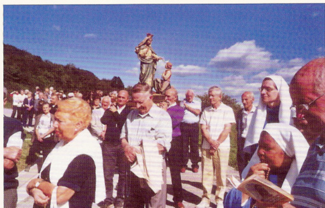
6-9-2009 la Processione.