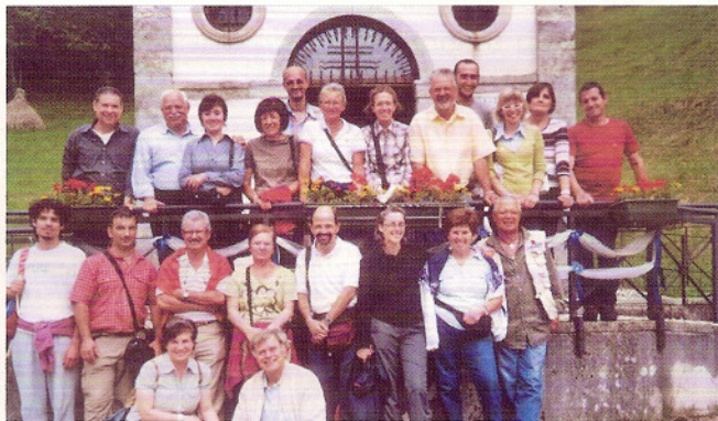
28-6-2009 gruppo sordomuti.