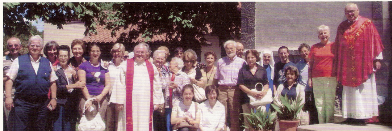
25 luglio 2009 gruppo carismatico di Assisi.