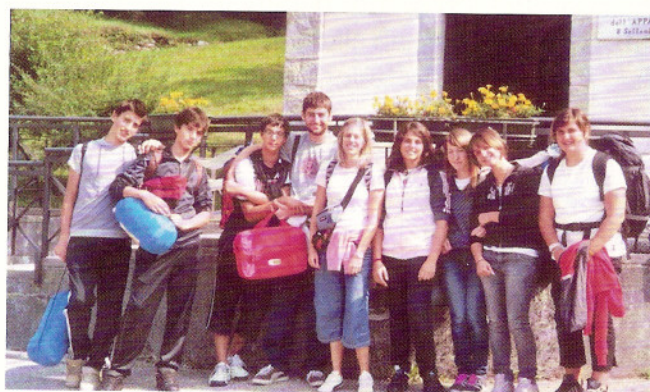
Settembre 2009 un gruppo di Cresimandi di Papatotti.